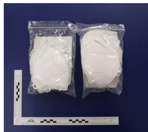
Verpackung / Packaging