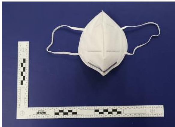
Frontansicht / Front view